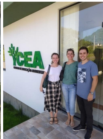
Visita ao Instituto Felinos do Aguai e à Fundação de Meio Ambiente de Nova Veneza - FUNDAVE