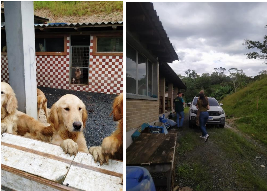
Fiscalização e autuação de situação de maus tratos.