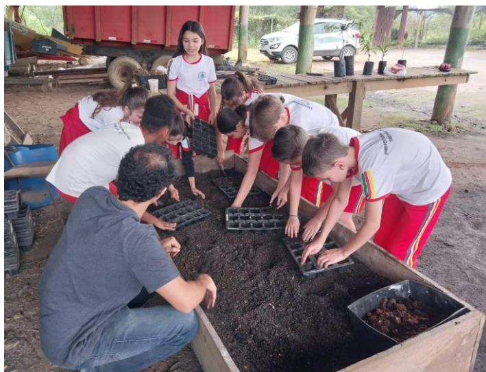
Dia da árvore - Atividade de plantio de palmeira juçara com alunos no Horto municipal.