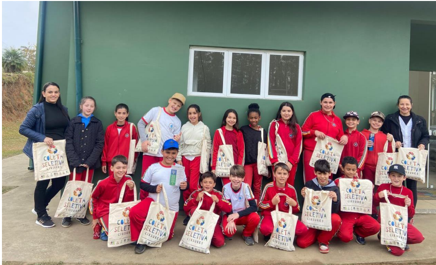
Visita guiada ao CIRSURES.