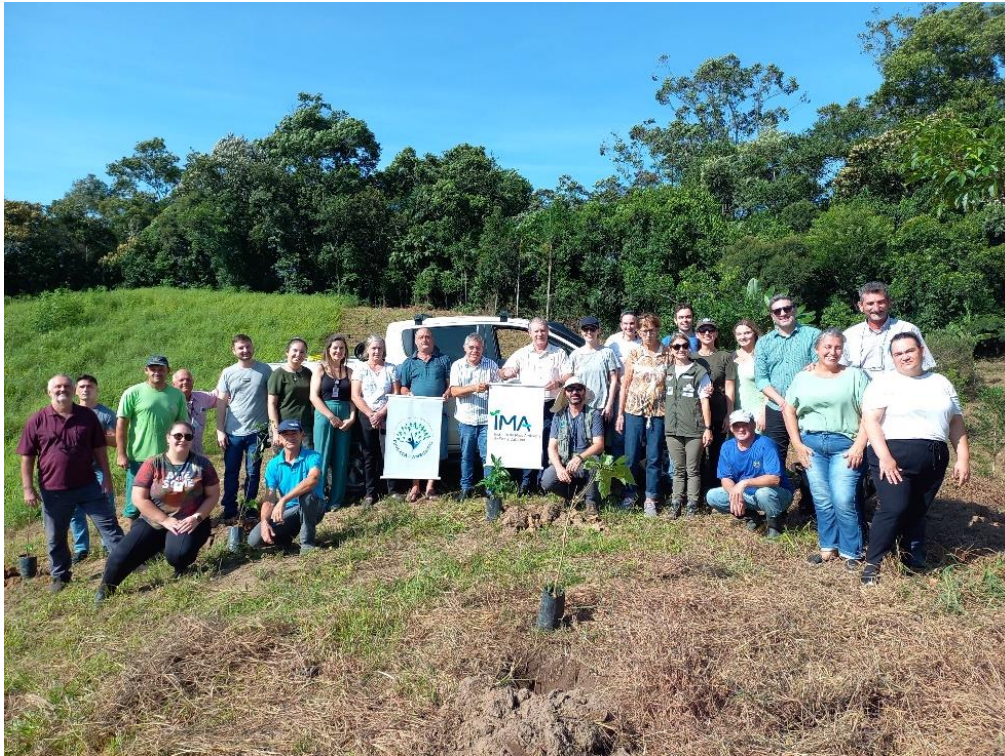
Recuperação de nascente no Morro São Pedro (20/03/2024)